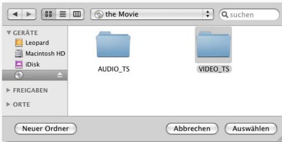
Abb.: Ordner Video_TS wählen

Im Dialogfenster suchen Sie das DVD-Laufwerk und öffnen es. Markieren Sie den Ordner Video_TS und klicken auf die Schaltfläche Auswählen .