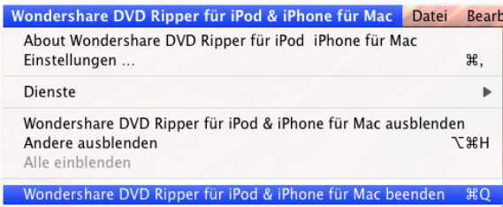
Abb.: Software beenden

Das Programm beenden Sie, indem Sie in der Menüleiste den Punkt Wondershare DVD Ripper für iPod & iPhone für Mac/ Wondershare DVD Ripper für iPod & iPhone für Mac beenden wählen.