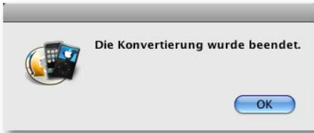
Abb.: erfolgreiche Konvertierung