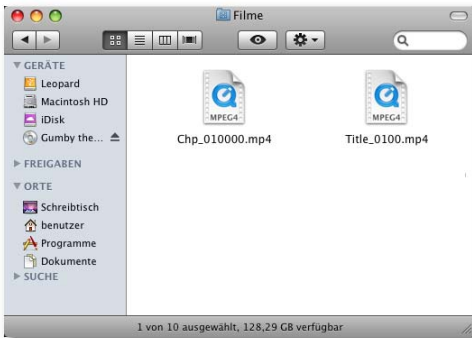
Abb.: fertig konvertierte Videos

Der Ordner wird geöffnet und die konvertierten Dateien angezeigt.